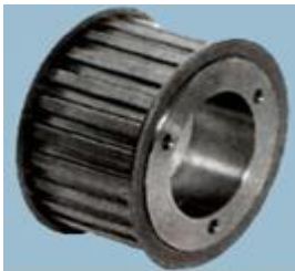
Timing Belt Pulley

Universal Timing poulies courroie assure plus la vie avec pratiquement aucun dérapage et silencieux ayant min. Retour coup de fouet, d'une certaine façon, la poulie est en acier ou en aluminium matériel, avec ou sans verrou conique / Bush que par l'exigence de la clientèle, usinées en générant des coupeurs de garniture, utilisé dans l'arbre à cames du moteur, courroie de distribution automobile et autres applications industrielles poulie.