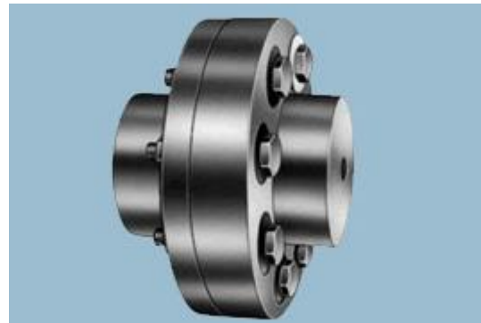
Pin Bush Acoplamento Flexível

Pino Universal Acoplamentos Bush garante um elevado binário transmissões de alta velocidade, de certa forma, ter engate choque notável capacidade de absorção devido à construção ser minorado unidade transmissora tipo de binário através de borracha arbustos, afectada pela água, poeira e condições atmosféricas permite conduzir em qualquer direcção que exijam sem lubrificação e nenhum ajuste após a instalação.