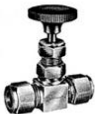
Aço Inoxidável Needle Valve

Fim Conexões: Screwed ao PSB / BSPT / rosca NPT, conexão socket, a dupla ponteira tubo montagem.